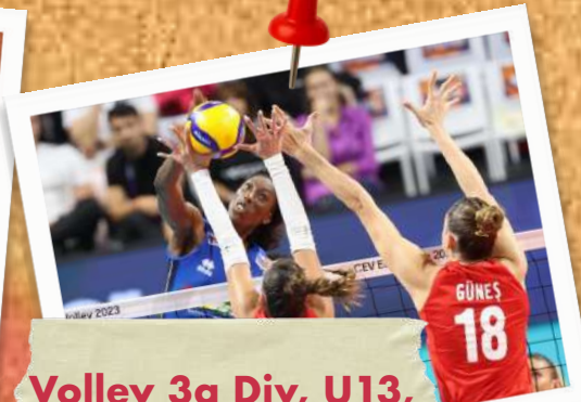
Volley 3a Div, U13, U16, Mini-volley