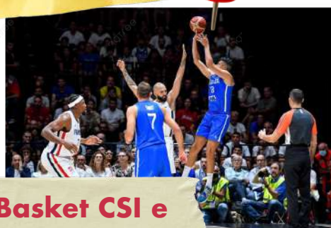
Basket CSI e Mini Basket